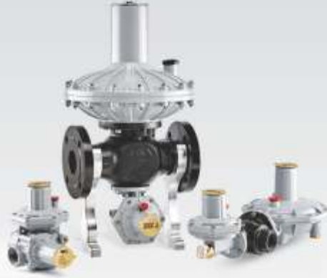
DİREKT ETKİLİ GAZ BASINÇ REGÜLATÖRLERİ