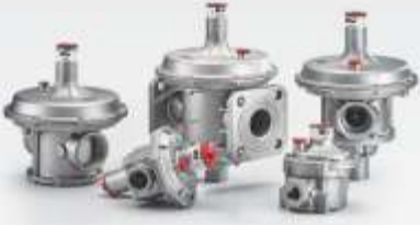
TEK KADEMELİ GAZ BASINÇ REGÜLATÖRLERİ