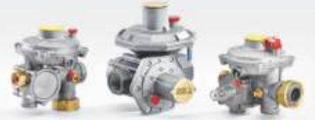
ÇİFT KADEMELİ SERVİS REGÜLATÖRLERİ