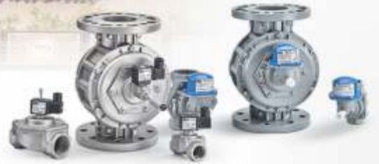
GAZ VALFİ VE DEPREM VANALARI